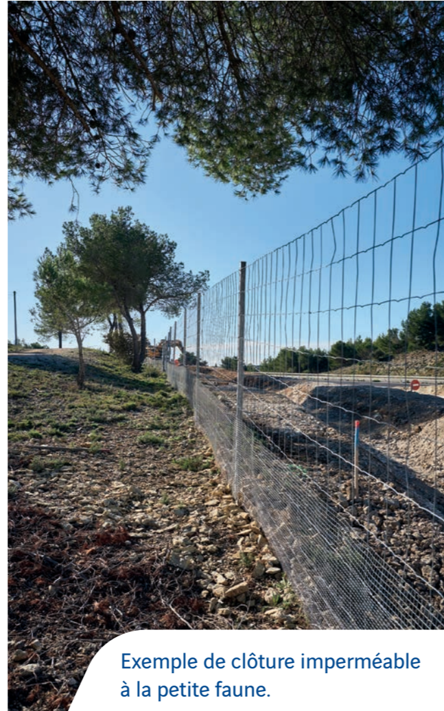
Exemple de clôture imperméable à la petite faune.