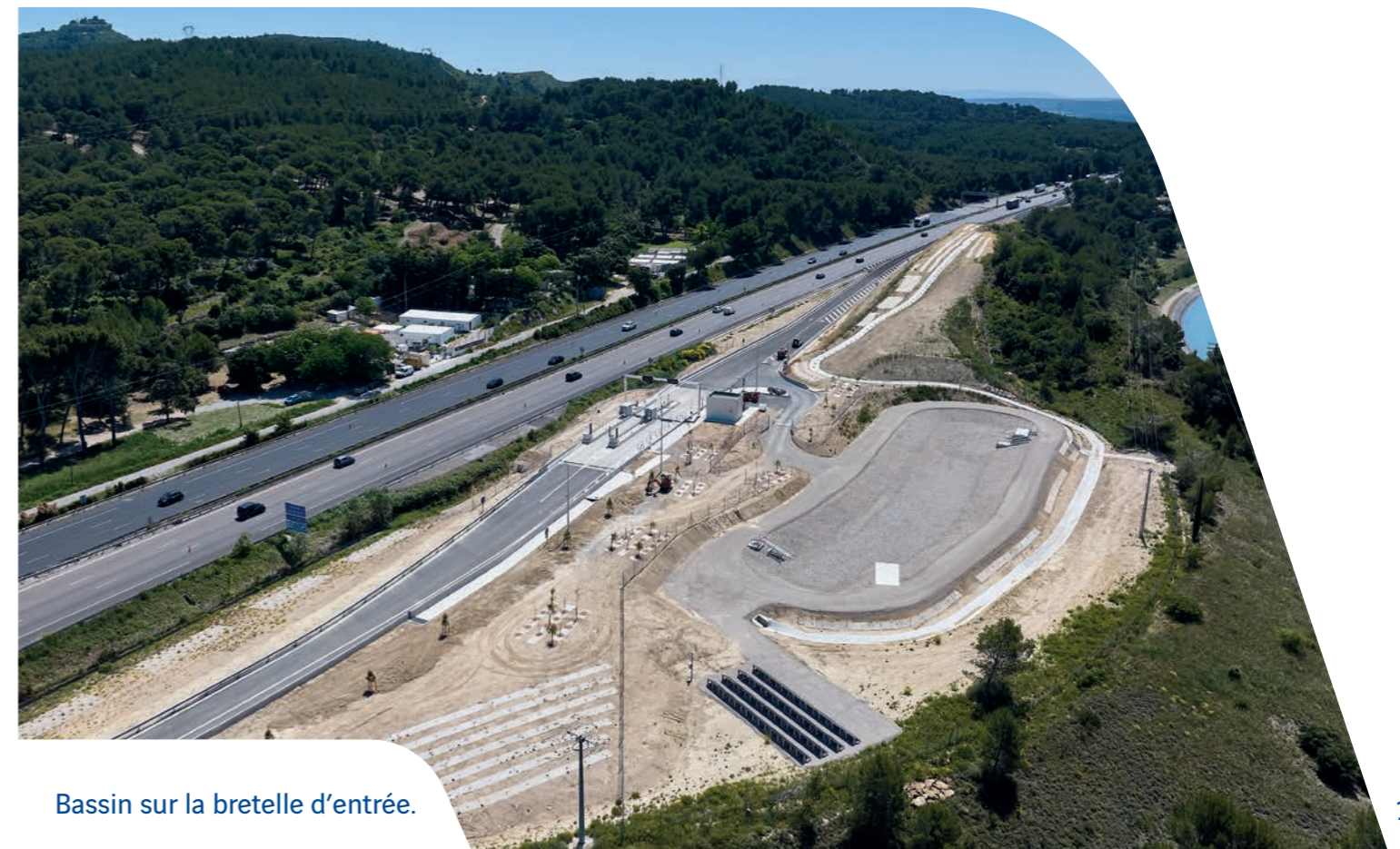
Bassin sur la bretelle d'entrée.