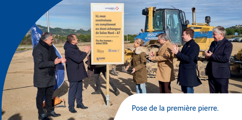
Pose de la première pierre.

Ce projet, inscrit au Plan d'Investissements Autoroutiers (PIA) depuis 2018 et déclaré d'utilité publique en 2023, répond à une demande de longue date du territoire salonais.