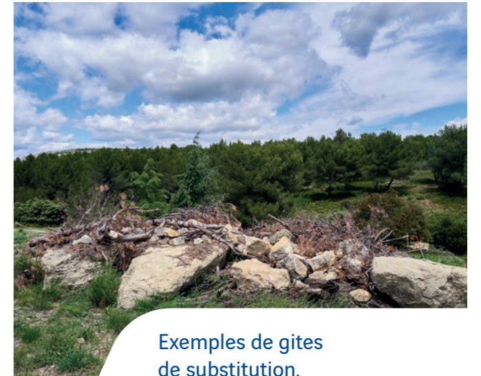
Exemples de gîtes de substitution.