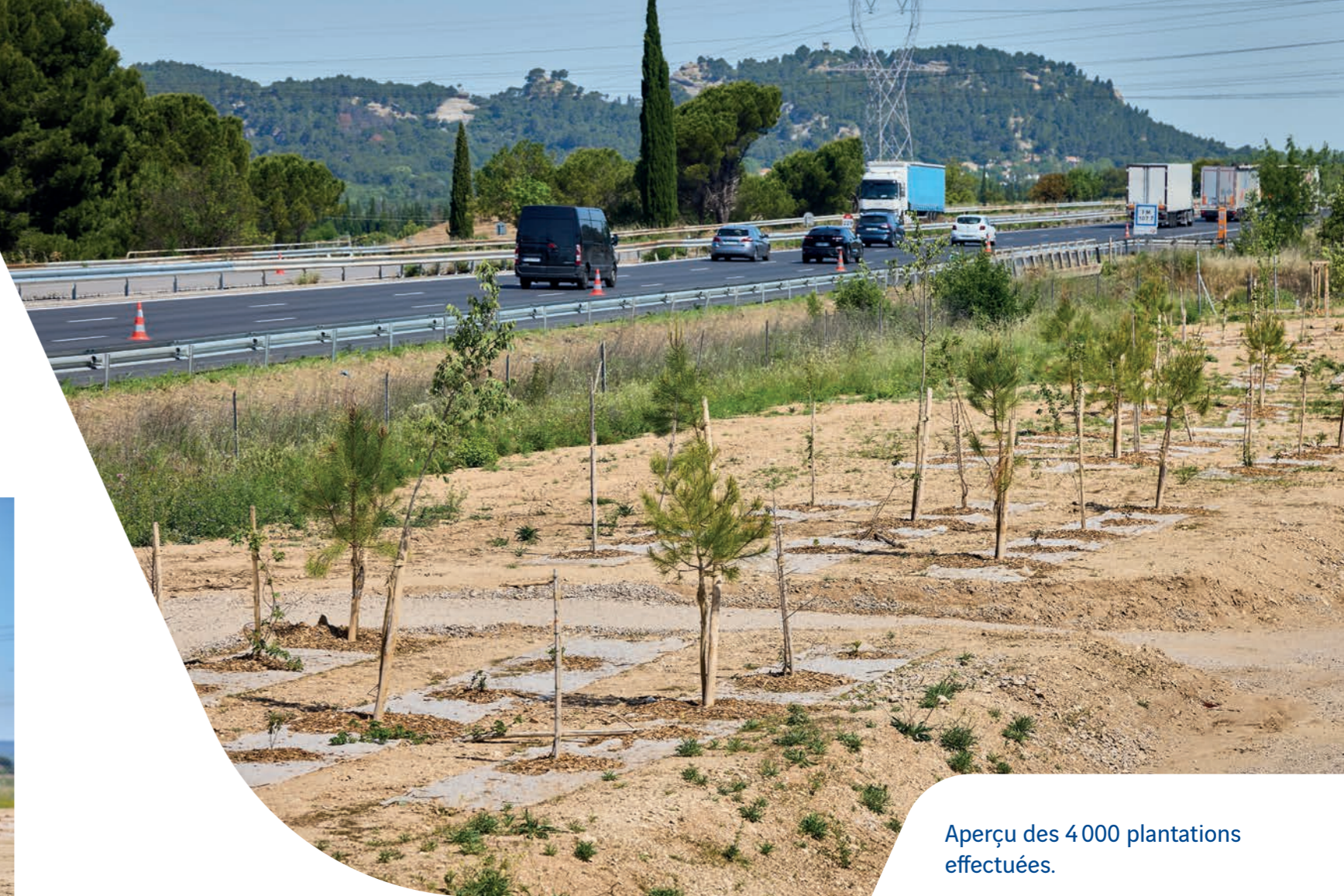
Aperçu des 4 000 plantations effectuées.