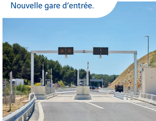
Nouvelle gare d'entrée.

Le nouvel aménagement comprend des gares de péage de nouvelle génération, sans auvent, qui s'intègrent mieux dans le paysage et présentent aussi un bilan carbone amélioré (avec moins de matières utilisées). De plus, l'alimentation électrique de secours de ces gares est rendue possible par des panneaux photovoltaïques installés sur site.