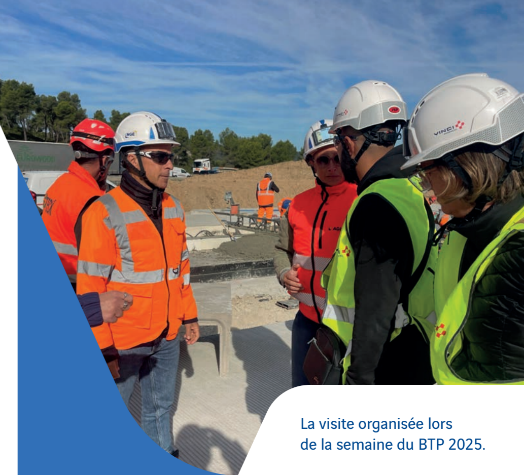
La visite organisée lors de la semaine du BTP 2025.