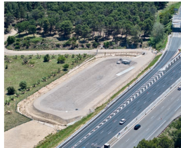
Bassin sur la bretelle de sortie.